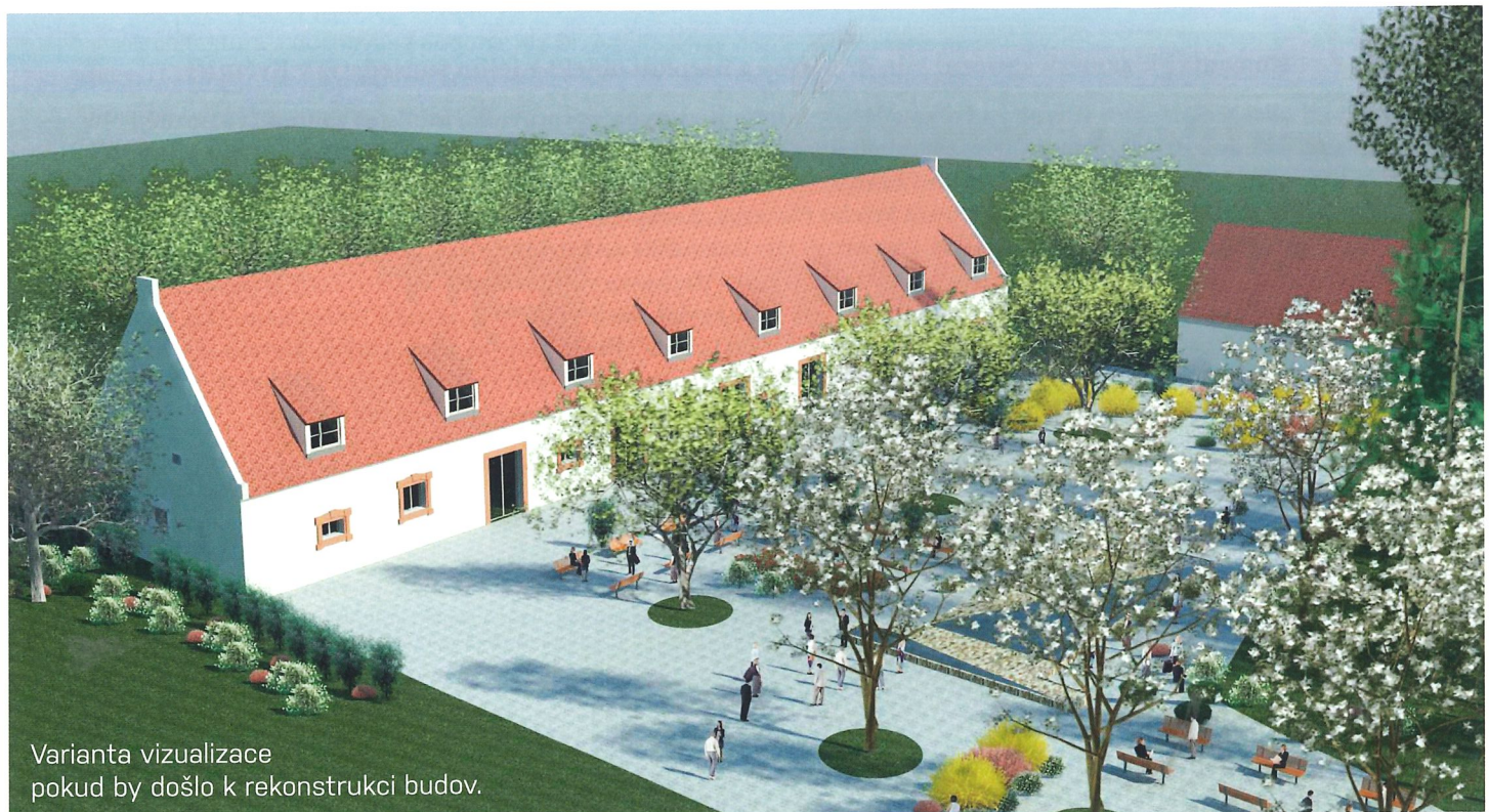
Varianta vizualizace pokud by došlo k rekonstrukci budov.