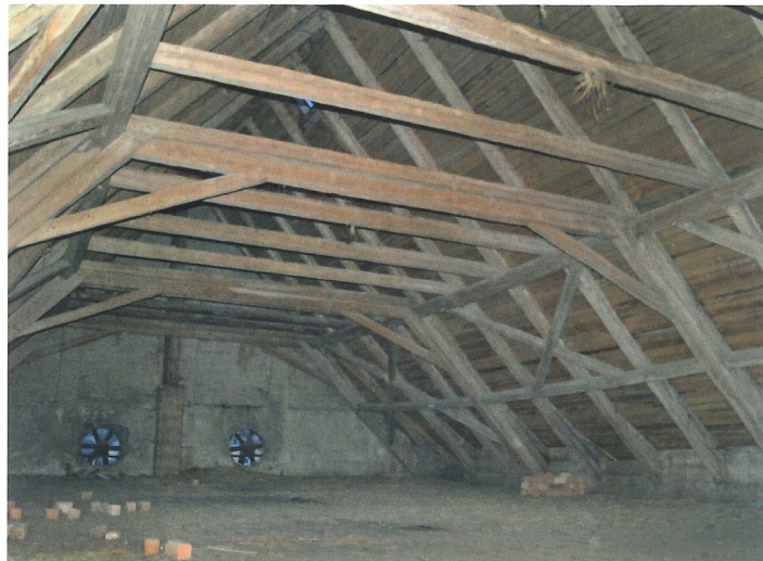
Dochovaný barokní krov západní budovy z 18. století △