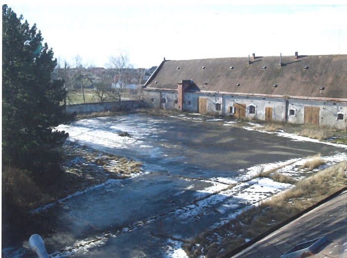
◁ Západní barokní budova a hlavní dvůr – náměstí

na veřejném zasedání dne 29. 4. 2020 pod usnesením č. 2020/03/XI dvůr v Květnici za kulturní dědictví venkova prohlásilo . Rozumí se tím, že je významnou historicko – architektonickou hodnotou naší obce a zastupitelstvo by mělo usilovat o jeho záchranu, a to zejména západní barokní budovu a přilehlé modernistické vily. To se však neděje.