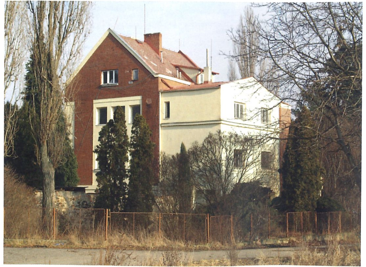
Modernistická Krýsova vila z 30. let 20. století

Dvůr byl postaven v 18. století jako zemědělská usedlost rodu Lichtenštejnů. Nejhodnotnější hospodářská budova, která sloužila patrně jako ovčín, má dodnes zachovalý původní barokní krov. Po válce zde komunisté zřídili plemennářský statek pro chov býků. Během této doby došlo k mnoha nevhodným zásahům do původní stavby. Na první pohled zaujme další stavba, atraktivní vila u rybníka v Květnici, kterou by na takovém místě málokdo očekával. Vznikla ve 30. letech 20. století jako unikátní typ venkovské vily při hospodářském dvoře, kterých v meziválečném období nevznikalo mnoho. Její majitel, JUDr. Adolf Krýsa, byl významným advokátem, který pracoval na Pražském hradě pro prezidenta Edvarda Beneše. Mimo to byl také podnikatel ve filmovém průmyslu a člen představenstva společnosti A-B rodiny Havlovy, která vybudovala filmová studia na Barrandově. Při stavbě vily tedy přenesl do květnického prostředí atmosféru pražské smetánky a vystavěl zde reprezentativní objekt zcela v duchu tehdejší moderny. Lze předpokládat, že jejím autorem byl s největší pravděpodobností někdo z okruhu zakladatele české moderní architektury Jana Kotěry, případně některý z žáků slovinského architekta Jožeho Plečnika. Ve vile její majitel přijímal významné hosty včetně tehdejšího prezidenta Edvarda Beneše. Krýsovy vily v Květnici se později dotkly nevhodné stavební zásahy, nástavbou přišla především o výrazný původní prvek – terasu s výhledem do kraje.